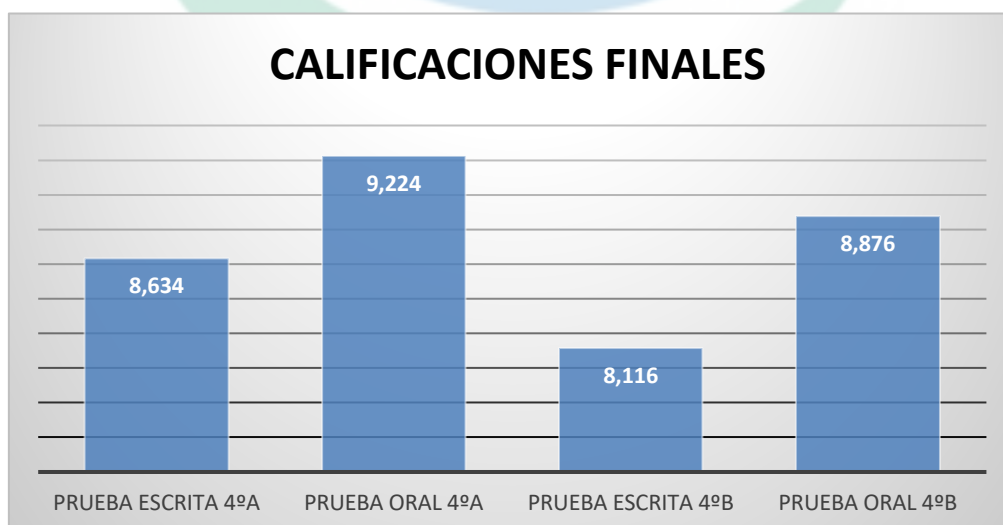
Figura 2. Calificaciones finales de 4ºA y 4ºB.

Nota. Se observa una mejora general en ambos grupos, con un incremento superior del grupo experimental (4ºA) respecto a sus calificaciones iniciales. El grupo 4ºB (control) también cuenta con una mejora, aunque en menor medida. Elaboración Propia.